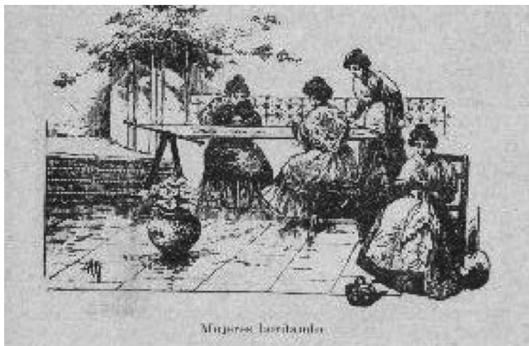
FIGURA 2. Imagen de mujeres bordando

Los libros y manuales reforzaban en las niñas el gusto por la costura, como se puede apreciar en la figura 2 de un libro de amplia difusión en el centro de México. 19